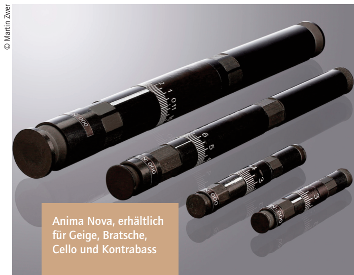
Anima Nova, erhältlich für Geige, Bratsche, Cello und Kontrabass