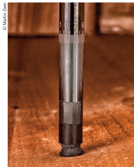
Das Kugelgelenk passt sich perfekt an die Innenwölbung von Decke und Boden; das eingefräste Präzisionsgewinde lässt sich um Zweihundertstelmillimeter verstellen und auch nachjustieren

Da eine optimierte Frequenzleitfähigkeit diese zentrale Funktion jedoch unterstützen kann, begann Molnar nach alternativen Materialien für die Fertigung des Stimmstocks zu suchen. Seine Entscheidung für den Werkstoff Karbon wurde schließlich durch eine simple Tatsache bestärkt: Ein Vergleich von Stimmstöcken gleicher Länge und gleicher Stärke bestätigte ihm, dass die Frequenzleitfähigkeit von Karbon aufgrund der exakt längs angeordneten Kohlefasern wesentlich höher ist als jene des weicheren und damit auch bestimmte Frequenzbereiche schluckenden Fichtenholzes, das zudem von Natur aus allerlei Unregelmäßigkeiten in Bezug auf die Faserung aufweist.